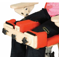
ZB_006 - Estabilizador de joelhos