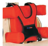
ZB_009 - Suporte peito e ancas com ajuste individual