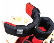
ZB_008 - Apoio de Cabeça Ajustável