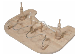
ZB_005 - Mesa de actividades