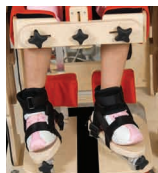
ZB_003 - Apoio de Pés Reguláveis (pronação e supinação)