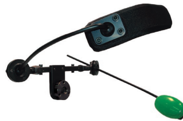
CPS9-B: com a almofada 930 no lado direito e com um Egg Switch verde (ESGRN) no lado esquerdo.