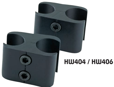
HW404 / HW406