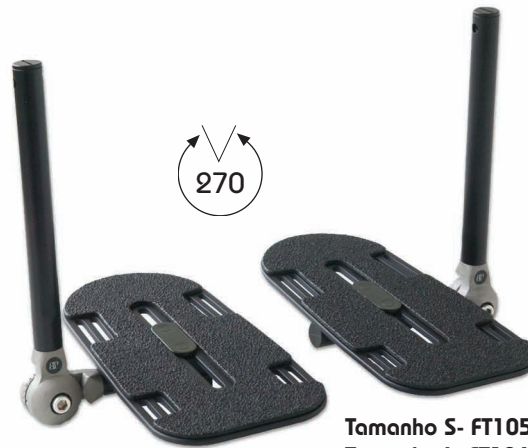
Tamanho S- FT105 Tamanho L- FT106